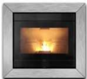
Optional: Cornice inox per Insert Line

Tutti i prodotti THERMOROSSI hanno garanzia 2 anni.