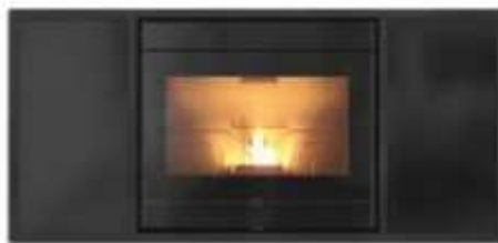
Optional: Cornice cristallo o ceramica per Insert Line (disponibile con cristallo bianco, bordeaux, nero, oppure in ceramica bronze, ollare, madreperla)